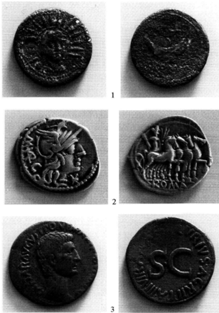
Abb. 1-3: Fundmünzen aus Pommern im Kulturhistorischen Museum Stralsund

Sammlung der Familie Schöneich im Schloß Karolath (poln. Siedlisko, Woj. lubuskie), die in Italien und Frankreich gesammelt worden war. Die Funde der Münzen von Augustus aus der Gegend von Elbląg (Elbing) 19 , Szczecin (Stettin, Abb. 1. 3) 20 , Stargard Szczeciński, Woj. zachodnio-pomorskie (Abb. 2) 21 , Gorzów Wielkopolski, Woj. Lubuskie 22 oder Bydgoszcz (Bromberg) 23 müssen also höchstwahrscheinlich für sekundäre Entdeckungen gehalten werden, weil diese Exemplare bestimmt erst in der Neuzeit nach Norden gelangten. Mehrmals gelang es, dies zu dokumentieren, wie z.B. bei einer Gruppe von Münzen, die angeblich in Danzig St. Albrecht entdeckt wurde, in der